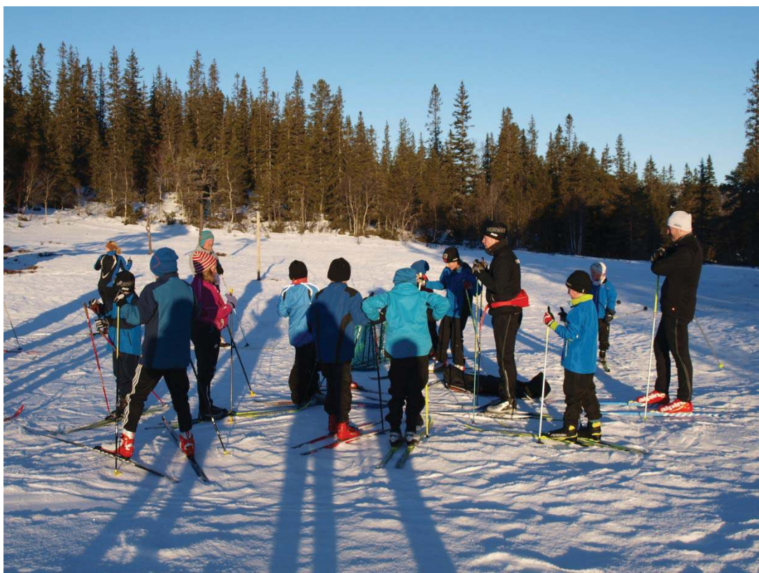
Fin vinterdag på Vola - skileik ledere forteller om dagens aktiviteter før oppstart