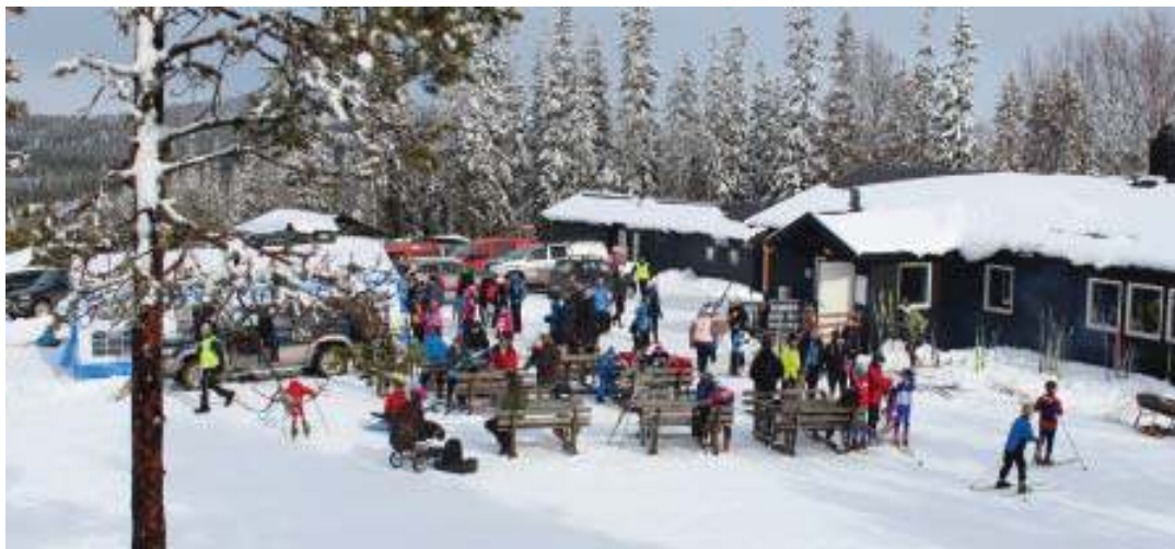
Familiedag på Henningvola