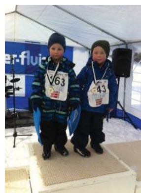
Spente gutter får sin medalje