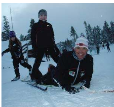
Skileik hver søndag - populært tilbud