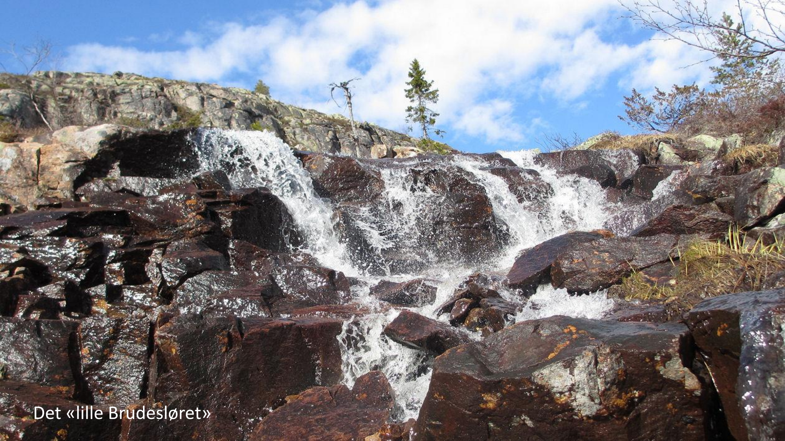
Det «lille Brudesløret»