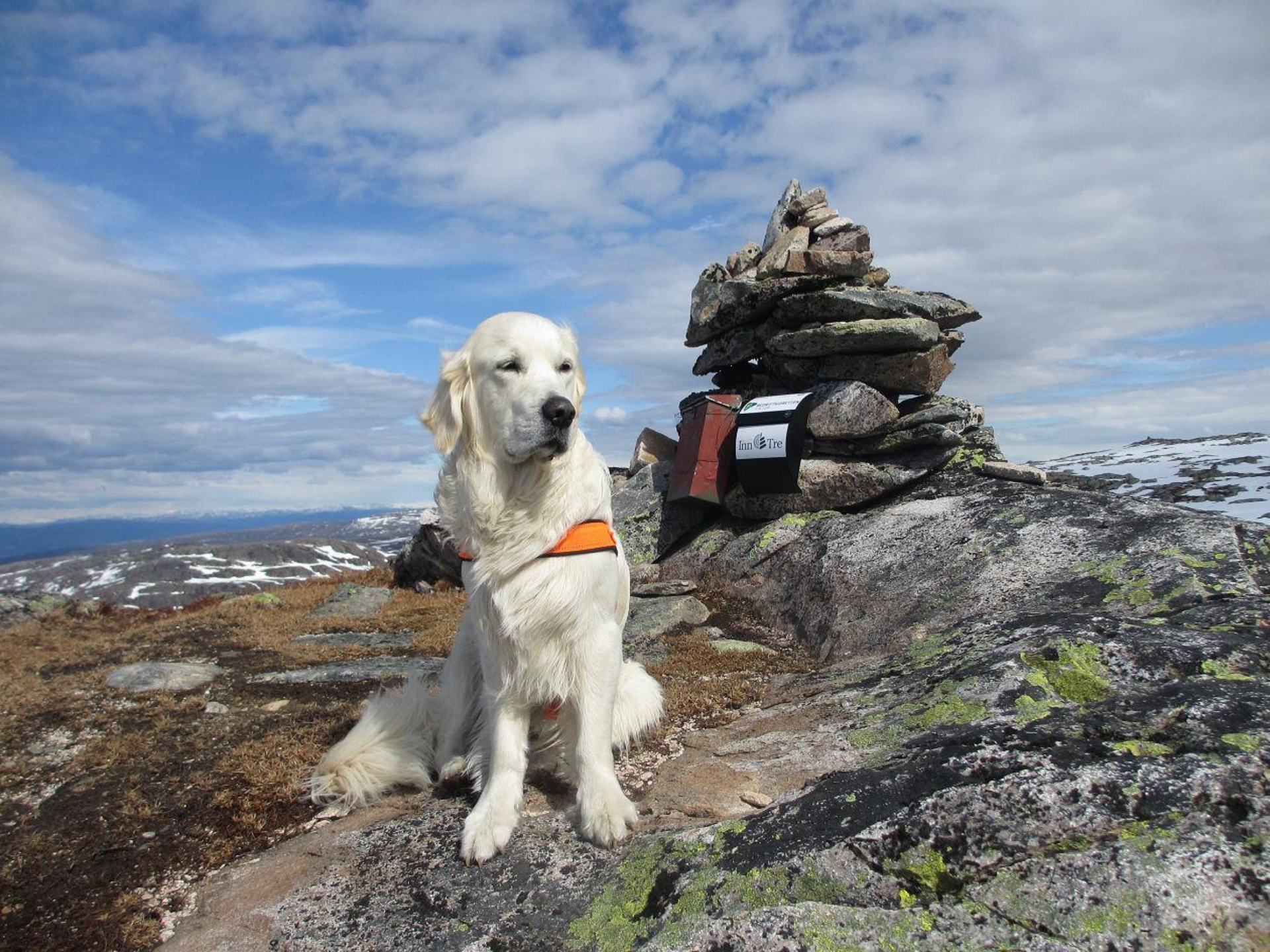
TIKO Kongen av Brannheiklumpen