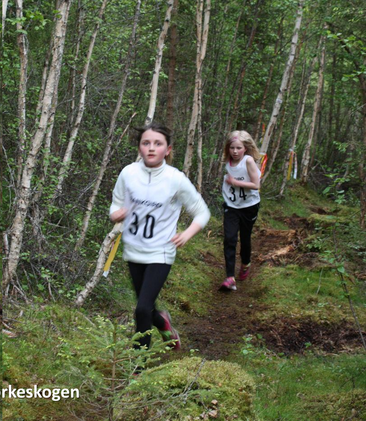
Stor fart i bjørkeskogen