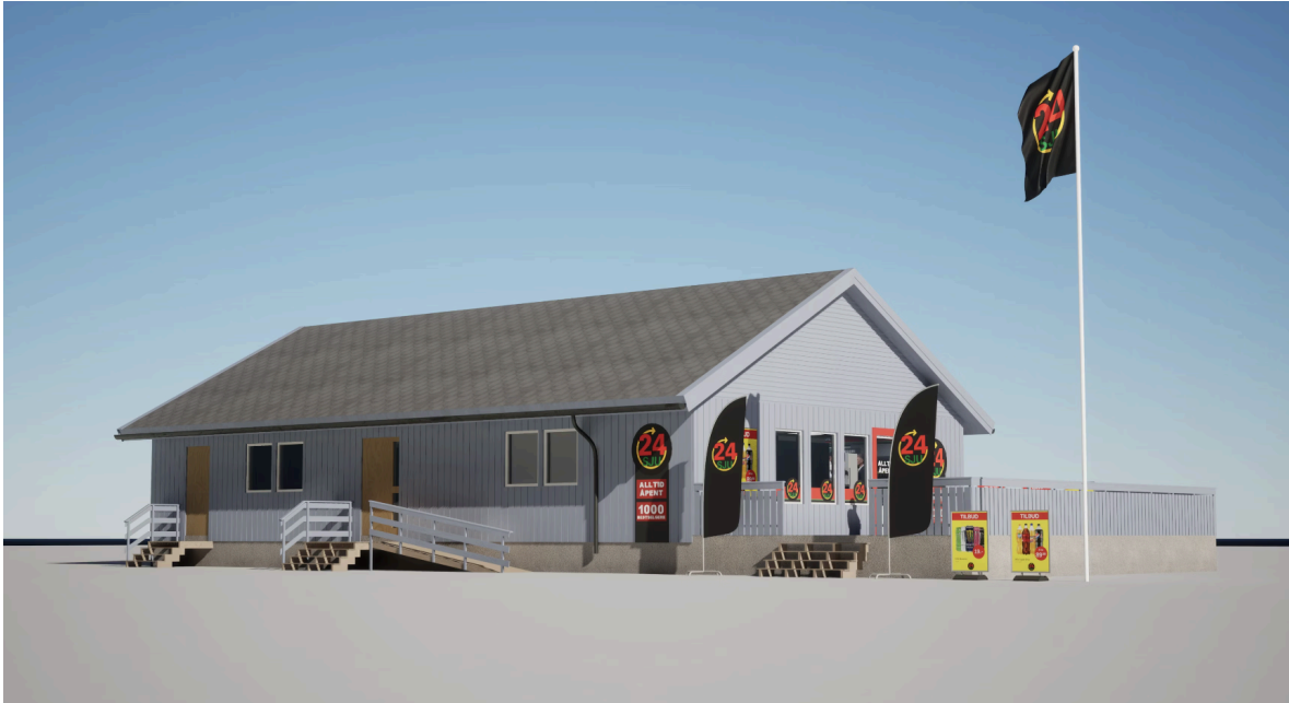
Butikken sett fra parkeringsplass.