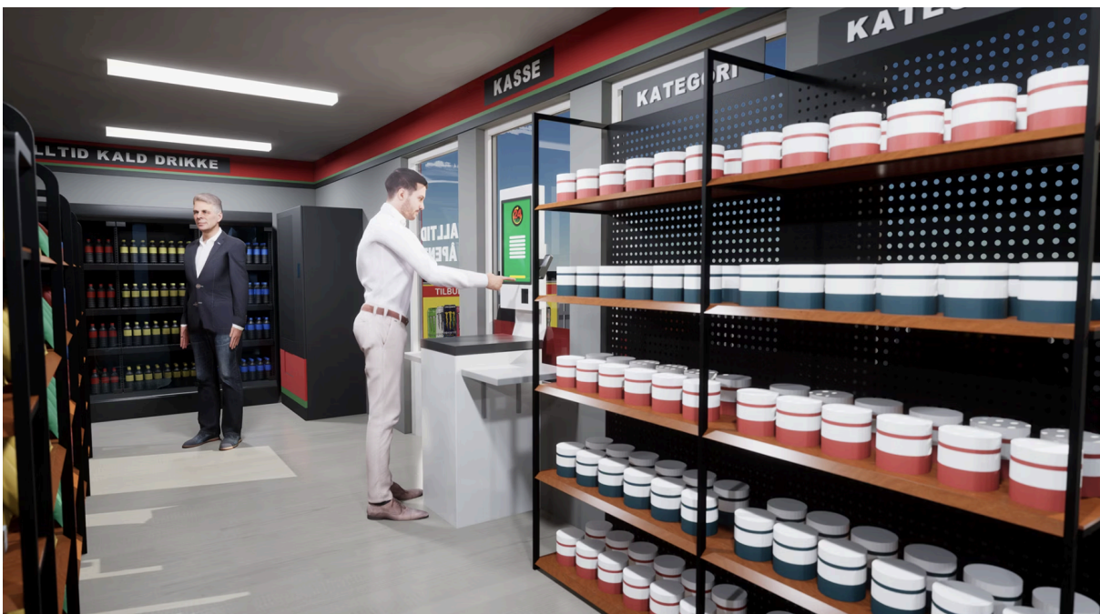
Innvendig i kasseområde.